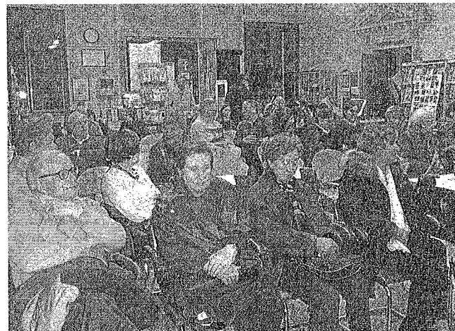
Parte del pubblico intervenuto alla presentazione in biblioteca. L.CRI.