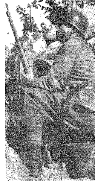
Un soldato delle Grande guerra

e l'altro per i lavoratori della Marzotto». Già, perché già da allora la Marzotto aveva un ruolo centrale nella vita cittadina. «È stato - prosegue Castagna - uno dei periodi più importanti per la storia valdagnese, con il passaggio da Gaetano Marzotto senior al figlio, Gaetano junior, che poi culminò con l'istituzione dei Premi Marzotto negli anni '50 del Novecento». Prima del teatro "Rivoli" (1937), i luoghi della cultura erano il teatro "Marconi" e l'"Utile et Dulci". «Durante la guerra molti soldati furono ospitati in città, dalle scuderie di Villa Valle alla Colombara