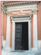
In alto Portale Duomo di Vicenza